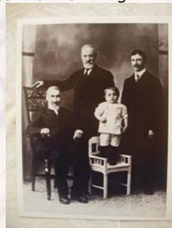
4 generasjoner Hamre

Min mormor som elsket håndarbeid, (hun sydde nesten alle mine klær på sin tråmaskin, og sydde om alle klær som hang på loftet), broderte også mye. Men hvis det var søndag ettermiddag, passet hun på tiden når oldefar var ventendes hjem fra sitt møte, så hun kunne legger det bort før han kom. Man gjorde ikke håndarbeid på søndag. Enda mormor aldri gikk i kirken (hun måtte jo lage stor søndag middag og ekstra mye på helligdager) så likte hun å synge salmer når hun strøk tøy. Jeg husker enda at jeg syntes "Kjærlighet fra Gud" var så nydelig, så den sang vi ofte.