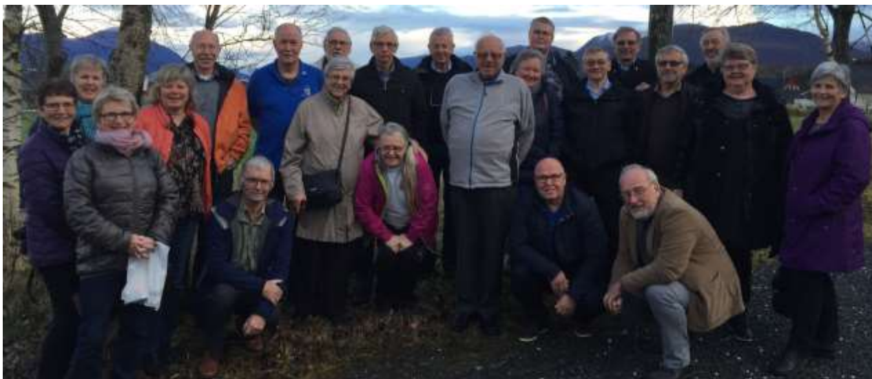
Stormøte i DIS-Møre og Romsdal med lederne fra alle de lokale gruppene til stede.