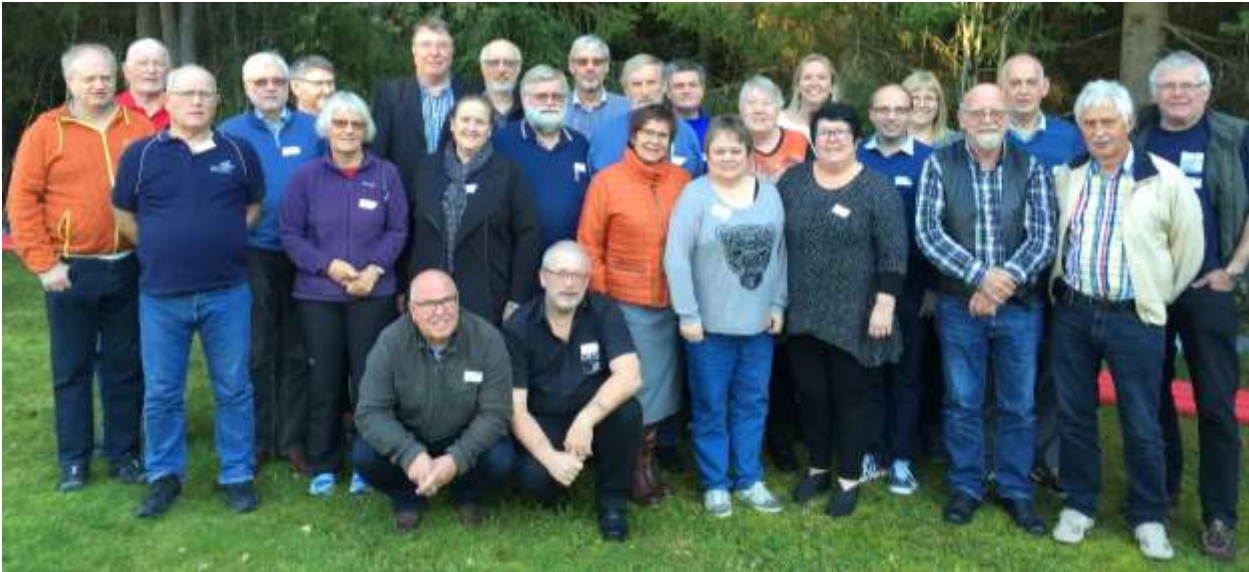
Ledersamlingen høsten 2015

Viktige møteplasser for kunnskapsdeling, inspirasjon og strategi.