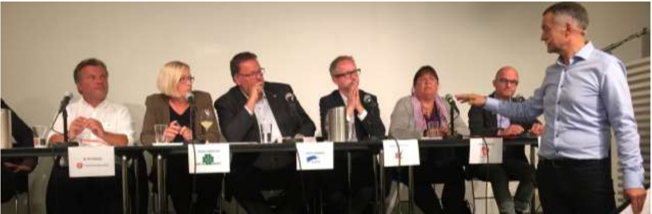
Fra politikerdebatten i regi av Norges Kulturvernforbund hvor DIS-Norge holdt innlegg

En samlet Familie- og kulturkomite skrev i sin innstilling til statsbudsjettet 2016 at slektsforskning er en viktig del av vår immaterielle kulturarv.