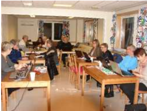
En vanlig torsdagskveld på Vestby bibliotek