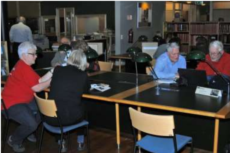
Slektshjelp og veiledning på Oslo byarkiv.