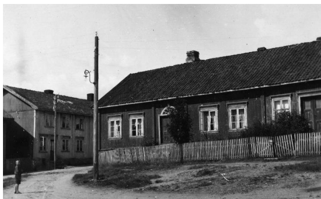
Skolegata 18 i Kongsberg. Fra arkivet etter fylkesskogmester Jørund Midttun.

På tirsdager har vi langåpent på lesesalen fra september fram til og med april, og en tirsdag i måneden vil vi ha et ekstra tilbud hvor vi stiller med hjelp fra Statsarkivet, Slegt og Data Kongsberg og IKA Kongsberg (Interkommunalt arkiv for Buskerud, Vestfold og Telemark). Dette er et tilbud for alle som er interessert i slekts- og lokalhistorie, og som ønsker veiledning og hjelp til å lete i kildene.