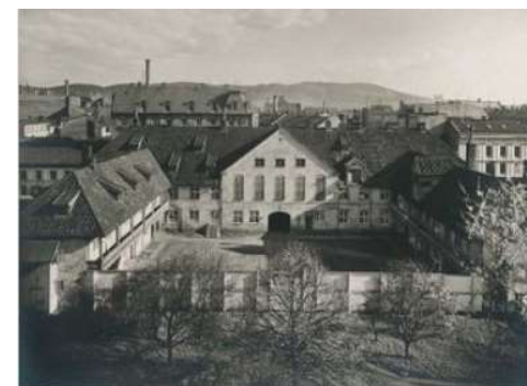
Tukthuset ca. 1910.