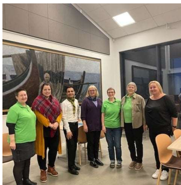
Arrangører og ressurspersoner.