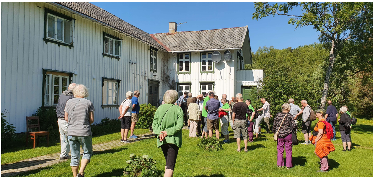
Juni-tur i varmt og vakkert vær til historiske Skagen gård på Straumøya.