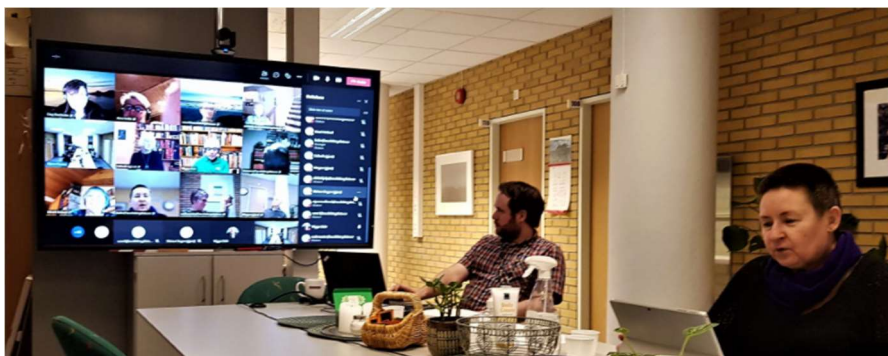
Årsmøtet i mars 2021 ble avholdt på Teams.

Som et nytt tilbud og for å nå ut til alle medlemmer som ikke kunne delta fysisk på møtene, har Intune AS streamet høstens møter for oss. Det har gitt et godt og profesjonelt resultat, og vi får gode tilbakemeldinger på dette tilbudet. Møtene kan ses på nett i sanntid, og kan også ses i opptak.