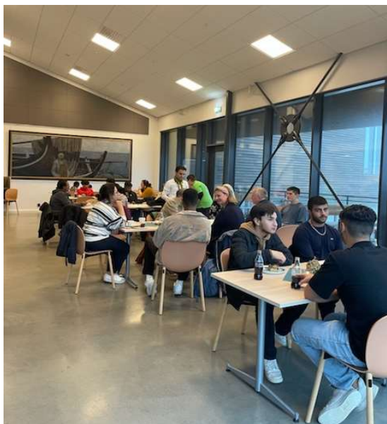
Lyttende og konsentrert under kafédialogen.