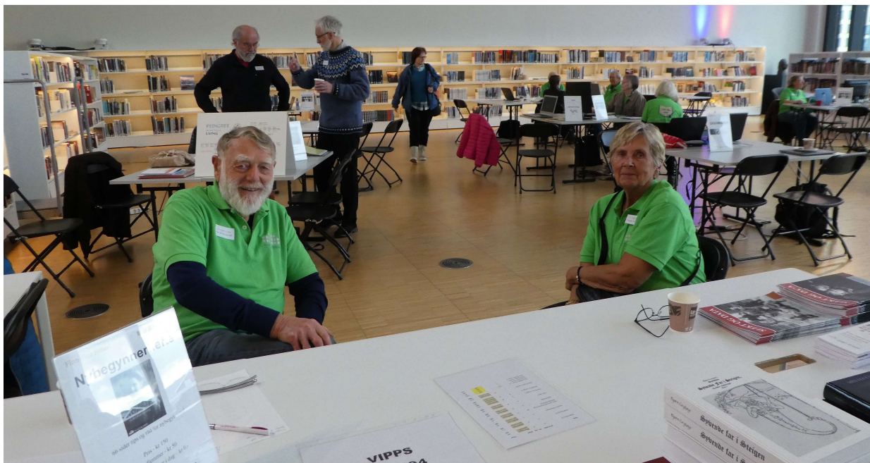
Klare for salg av bøker med mer på Slektforskerdagen i oktober.

Slektsforskerdagen 2021 ble arrangert lørdag 16. oktober. Årets tema var Alternative kilder . Arrangementet ble som vanlig holdt i Stormen bibliotek med foredrag og slektstorg. Her fikk publikum hjelp og veiledning, og det var salg av slektsmaterieell og lokalhistoriske bøker. Publikumstilstrømningen var svært lav, ca 50 personer besøkte oss fysisk. Foredragene ble streamet, og statistikken viser at flere så disse både i sanntid og i ettertid.