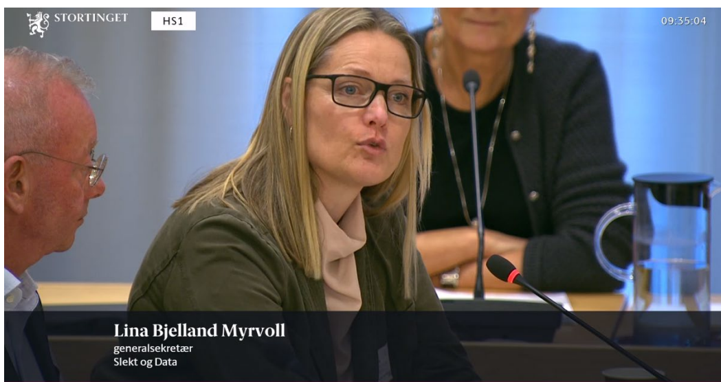
Budsjettføring i Familie- og kulturkomiteen på Stortinget

Slektsforskning er en viktig del av vår immaterielle kulturarv. Uten slekts- og personhistoriene risikerer vi at viktig samfunnshistorie går tapt.