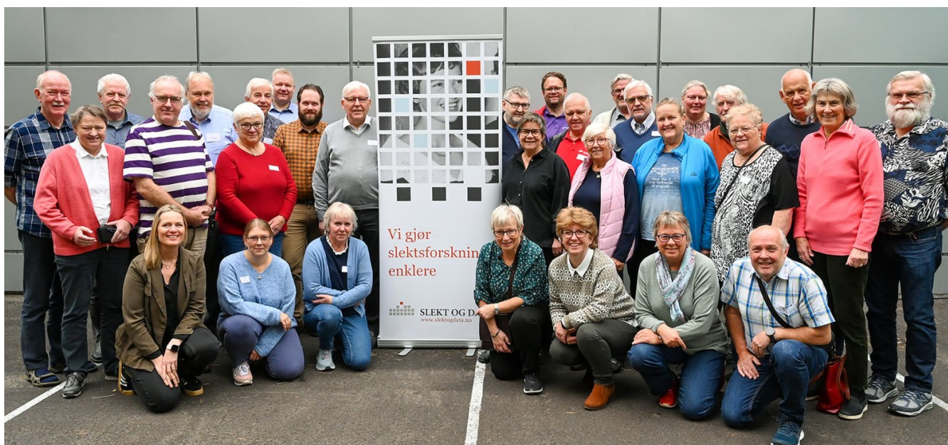
Ledersamlingen i 2022

Viktig møteplass for kunnskapsdeling og forankring av strategiske valg.