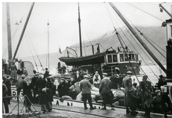
Fra Tromsø under tvangsevakueringa høsten 1944.

Møtelokalet Festsalen ligger i 4. etasje i “Rødbanken”. Inngang via bankens hovedinngang fra Storgata eller fra Fredrik Langes gate.