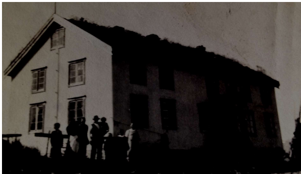
Bilde fra boka om matrikkelgården Tisnes