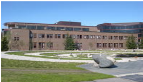
Statsarkivet i Tromsø på universitetsområdet i Breivika

Statsarkivet i Tromsø, Huginbakken 18, 9019 Tromsø