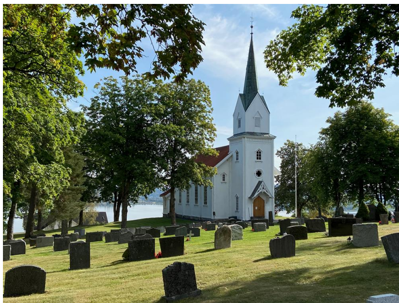
Rælingen kirke og kirkegård ligger vakkert til på høyden opp fra Øyeren.