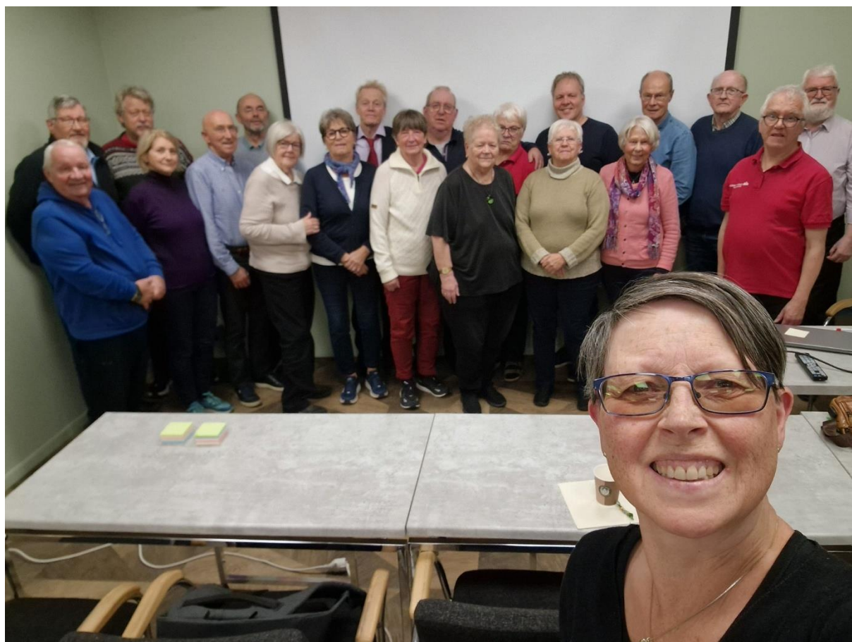
Deltakerne på tillitsvalgtsamlingen i oktober.