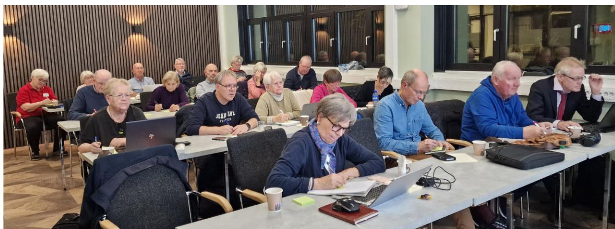
Fra et av årets mange kurs

Vi har gjennomført fem slektskaféer i Kulturvernets hus, Øvre Slottsgate 2 B, i 2024. Kaféene er alltid siste lørdag i måneden med unntak av mars, april, juni, juli, august, oktober og desember. I år ble det mye røddager og kollisjoner med andre arrangementer. Vi hadde besøk av Oslo byarkiv i januar. Vi var totalt 158 deltakere for å få hjelp/yte bistand med slektsforskning og sosialt samvær med likesinna.