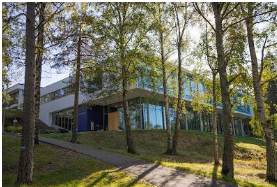
Arkivverkets bygning ligger flott til i skogen like ved Sognsvann T-banestasjon.

I år har vi vært tilstede ni onsdager og hadde besøk av 103 personer. Antall besøkende varierer veldig og vi får mye forskjellige forespørsler. Noen vil finne sine biologiske foreldre og tror vi kan «trykke på knappen». Vi får også høre mange slektshistorier, både de gledelige og de som ikke er så hyggelig.