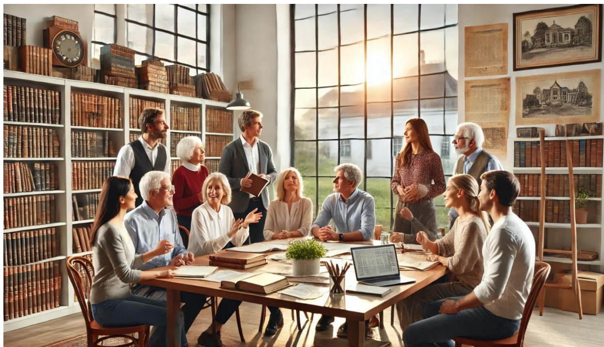
Illustrasjonsbilde laget av ChatGPT for Jan Edner