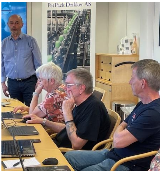
Fra et møte i Slekt og Data Aurskog-Høland

På grunn av møtekollisjoner i møtelokalene flyttet vi våre møter til tirsdager i 2024. Vi har hatt 17 møter. Totalt har det vært 117 deltakere, med noe varierende oppmøte fra 4 til 13 besøkende hver gang.