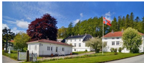
Dalane Folkemuseum på Slettebø

Slektsgranskergruppen i Egersund avholder sine møter i lokalene til Dalane Folkemuseum på Slettebø.