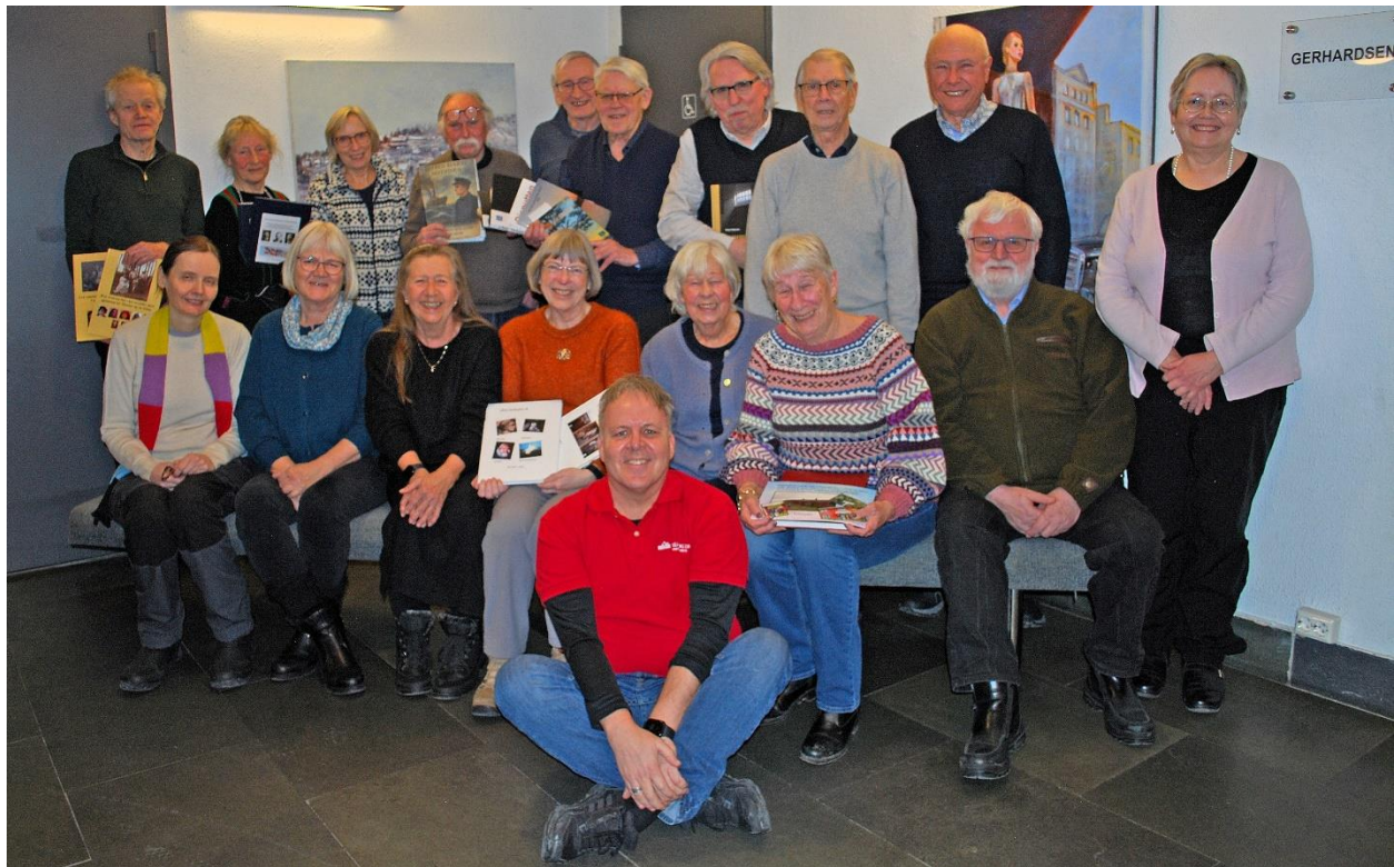
Fra en pause i et møte i Slektsbokgruppa.