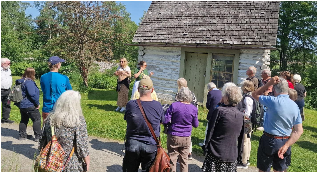
Et av de første norske husene i Amerika, på Utvandrer-museet.

Årets sommertur ble arrangert lørdag 14. juni 2025. Det ble en utflukt med veteranbuss til Utvandrer-museet på Ottestad, i anledning utvandringjubileet Crossings 200. Vi fikk både omvisning ute og foredrag om museets arkiver.