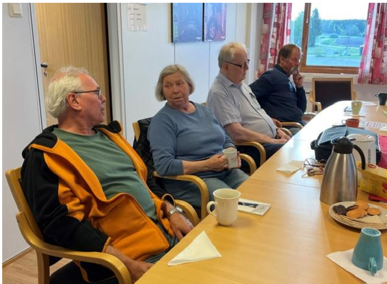
Fra et møte i Aurskog-Høland.

Fra 2025 er våre møter avholdt andre og fjerde tirsdag i måneden. Vi har hatt 15 møter. Totalt har det vært 115 oppmøter, med noe varierende oppmøte fra 6 til 12 deltakere hver gang.