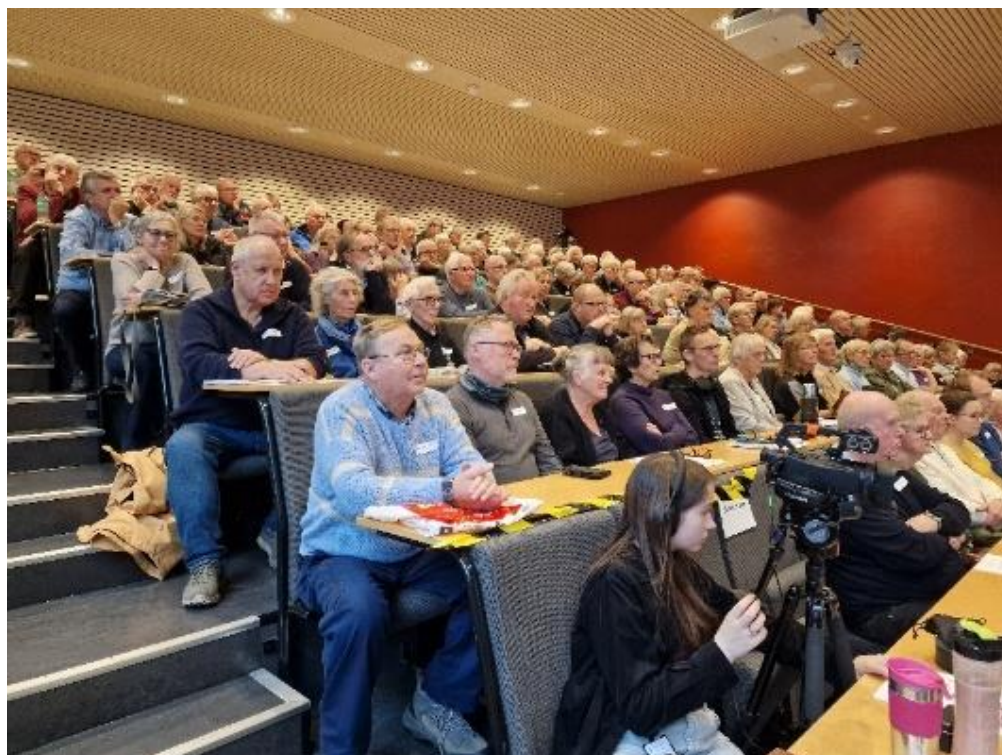
Fullt hus i Wergelandsalen på Slektsforskerdagen.

Slektsforskerdagen regnes som vårt flaggskip, og også i 2025 ble arrangementet en stor suksess. Takket være Arkivverket og Oslo byarkiv kunne vi tilby foredragsholdere og et program som ga både glede, kunnskap og underholdning til våre gjester. Wergelandsalen var mer enn full under den innledende hilsenen og de tre foredragene, som bød på både lærdom, latter og en liten smakebit på hva som venter i 2027.