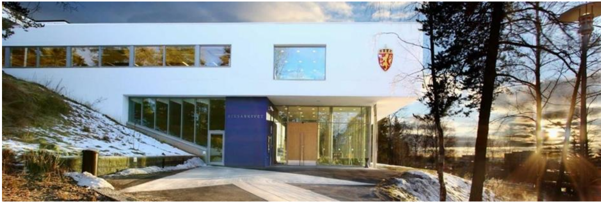
Riksarkivet (nå Nasjonalarkivet) på Sognsvann i Oslo.