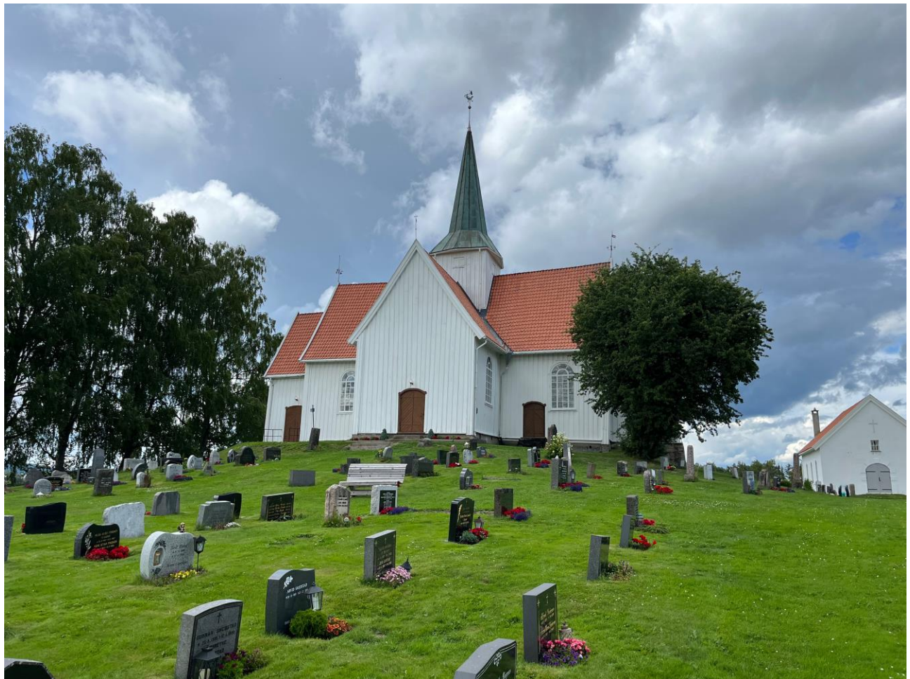
Gjerdrum kirke og kirkegård.

I Oslo mangler vi fast fotograf på Bekkelaget urnelund, og det er behov for hjelp på de store gravplassen, særlig på Grefsen kirkegård hvor det gjenstår en rekke felt som ikke er førstegangs fotografert. På Vestre gravlund, Vår Frelsers gravlund og Nordre gravlund regner jeg med at vi vil være ferdig med førstegang fotografering av alle feltene i løpet av 2026, men her er det behov for oppdaterings-fotografering av tidligere fotograferte felt.