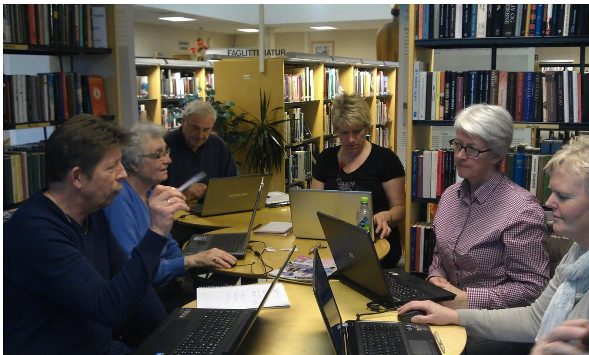
Bildet er fra et av de tidligste møtene på det «gamle» biblioteket i Vestby.